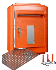
Kit de fixation mural