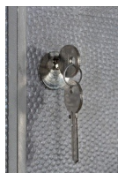
Détail des clés et serrure

Fixation : livrée avec 3 chevilles M10, 3 vis M10 type tire fond et 3 rondelles pour fixation murale.