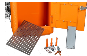
Grille de fond