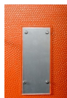
Détail porte étiquette avec plaque aluminium et polycarbonate