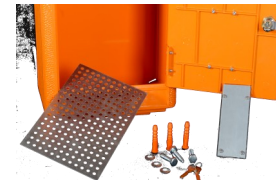
Grille de fond