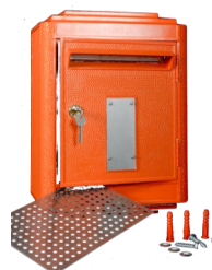
Kit de fixation mural