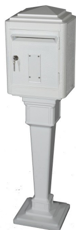
Pied officiel adaptable

Fixation : livrée avec 3 chevilles M10, 3 vis M10 type tire fond et 3 rondelles pour fixation murale.