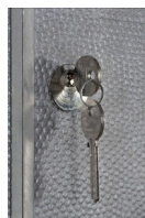
Détail des clés et serrure